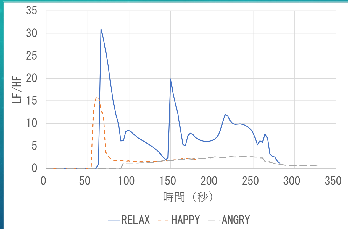
図2は、それぞれの状態での LF/HF の変化の様子をグラフで示したものである。グラフから判断すると、ANGRY が最も変動が少なく、RELAX が最も変動が大きいことがわかる。HAPPY の変動は高値から低値まで比較的規則的だが、変動は短いピークがあり、その後は安定する傾向が見られる。